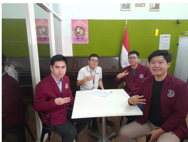
Gambar 1. Pertemuan Antara Perwakilan Tim STIE Ciputra Makassar dan SMA Dunia Harapan

Dunia Harapan, antara lain: kesepakatan pelaksanaan pelatihan, draf rundown acara, dan konsep acara. Gambar 1 menunjukkan pertemuan antara tim STIE Ciputra Makassar dan SMA Dunia Harapan.