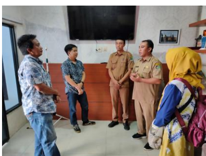
Gambar 2. Pertemuan Bersama Perangkat Desa

wisata, sehingga dapat diupayakan pengadaannya secara efektif. Infrastruktur berupa bangunan untuk memajang atau menempatkan merchandise masih dalam proses pengerjaan karena baru direncanakan akhir 2022. Luarannya berupa sarana-prasarana material, baik bangunan fisik maupun fasilitas promosi merchandise yang berhubungan dengan ritual adat seblang dan kuliner khas Olehsari.