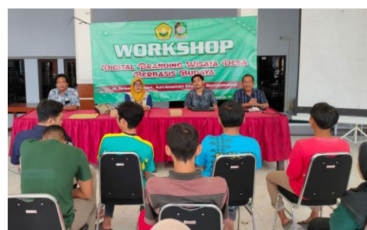
Gambar 4. Dokumentasi Program

Dapat digarisbawahi bahwa rencana solusi yang ditawarkan adalah: (1) penyiapan SDM pengelola wisata dengan melibatkan stakeholder , (2) penyediaan infrastruktur pendukung wisata budaya (di antaranya sarana akomodasi, transportasi, komunikasi, kuliner, dan keperluan kelengkapan lainnya), (3) dan mengoptimalkan branding dan marketing wisata budaya melalui web desaolehsari.com dan media sosial yang lain.