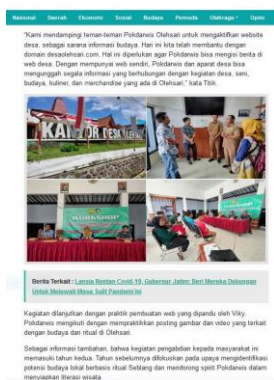
Gambar 5. Artikel Berita

Kegiatan pengabdian ini adalah untuk melakukan branding dan marketing wisata budaya berbasis ritual adat Seblang di Desa Olehsari Banyuwangi kepada wisatawan dan masyarakat umum. Tujuan utama tersebut dilaksanakan dengan cara publikasi pada berbagai media (cetak, elektronik, sosial, youtube), termasuk publikasi ilmiah pada jurnal, dalam prosiding seminar, modul, hingga branding dan marketing wisata budaya berbasis ritual adat Seblang di Desa Olehsari Banyuwangi.