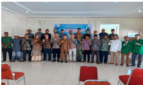
Gambar 2. Kegiatan Pelatihan Penyusunan Qanun Gampong di Gampong Bie

dilanjutkan di balai Gampong Bie, seluruh unsur penting Gampong hadir beserta 46 peserta.