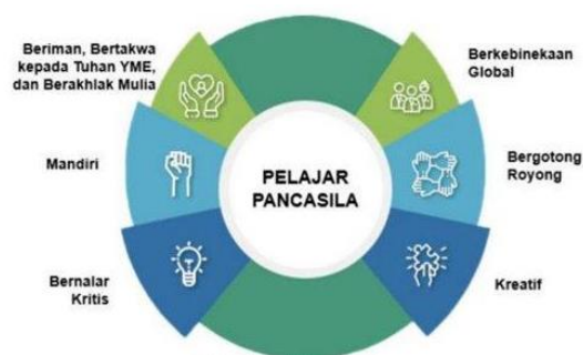
Gambar 1. Dimensi Profil Pelajar Pancasila

untuk membentuk pelajar pancasila menjadi sistem penting yang dapat merubah pendidikan Indonesia ke arah yang baru dan lebih baik. Profil pelajar pancasila menurut (Kemendikbud, 2021; Rachmawati et al., 2022) ada 6 profil yang menjadi kompetensi inti dalam program guru penggerak dalam mewujudkan profil pelajar pancasila. Diantaranya; 1) beriman, bertaqwa kepada Tuhan dan berakhlak mulia; 2) mandiri; 3) bernalar kritis; 4) kreatif; 5) bergotong royong; 6) berkebinekaan global. Profil tersebut dapat diilustrasikan dalam bentuk gambar berikut: