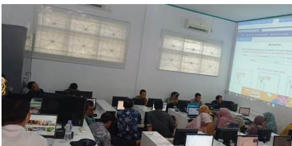
Gambar 3. Kegiatan Pelatihan

Adapun pendampingan pengembangan dan penerapan proyek penguatan profil pelajar Pancasila di SDIT Al-Multazam Kuningan memberikan implikasi kepada pihak peserta didik guru dan pihak sekolah. Bagi peserta didik,