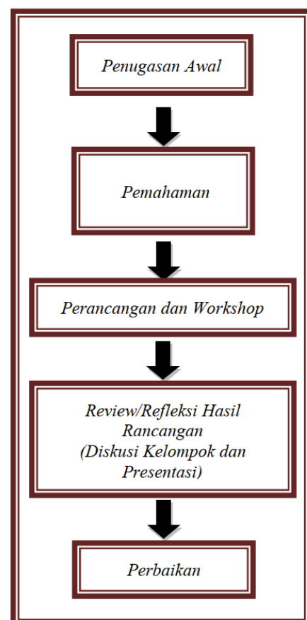
Gambar 1. Tahapan Pembekalan

Tahapan Pembekalan 1 dan 2: Tatap Muka (Bagian Kesatu dan Kedua)