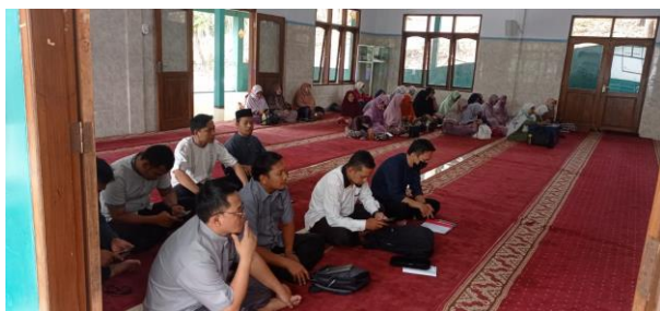
Gambar 4. Dokumentasi Penyampaian Materi

Tindak lanjut dari kegiatan pelatihan ini akan dilakukan berdasarkan hasil evaluasi. Hasil evaluasi diperoleh dari tanggapan peserta