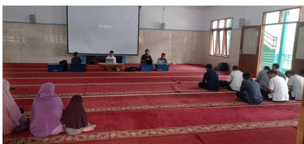
Gambar 3. Dokumentasi Penyampaian Materi

kecerdasan religius, Emotional Spiritual Quotient (ESQ) siswa. Kegiatan pembelajaran pengintegrasian konsep ESD dan agama atau nilai religius dapat diterapkan hampir pada semua mata pelajaran yang melibatkan kegiatan proyek atau aktivitas yang berorientasi ESD untuk mendorong kemampuan siswa dalam peningkatan kesadaran keberlanjutan dan keyakinan agama dalam memperoleh ilmu pengetahuan (Yulianto, dkk., 2021). Pengintegrasian konsep ESD dan agama atau nilai religius dapat dimuat dalam kurikulum secara eksplisit pada rancangan perencanaan pembelajaran, strategi pembelajaran, penilaian, bahan ajar tentang kesadaran keberlanjutan dan keyakinan agama atau nilai religius dalam memperoleh ilmu pengetahuan. Adapun untuk dokumentasi kegiatan pelatihan pengembangan perangkat pembelajaran berorientasi ESD terintegrasi nilai religius yakni.