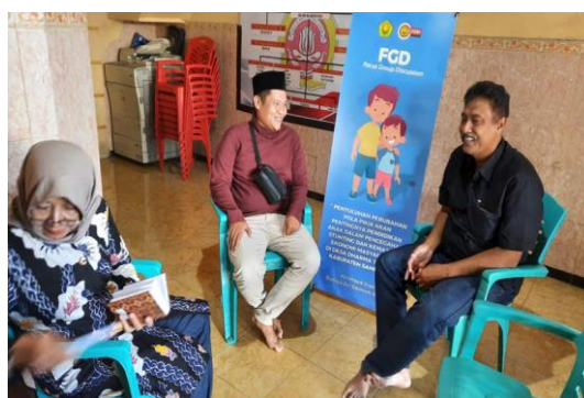
Gambar 2. Wawancara dengan setiap Kepala Dusun

bisa melaut. Hal ini diketahui ketika dilakukan Tanya jawab saat FGD dan saat diwawancarai dari masing-masing kasun. Berikut salah satu kasus yang diwawancarai secara bergiliran.