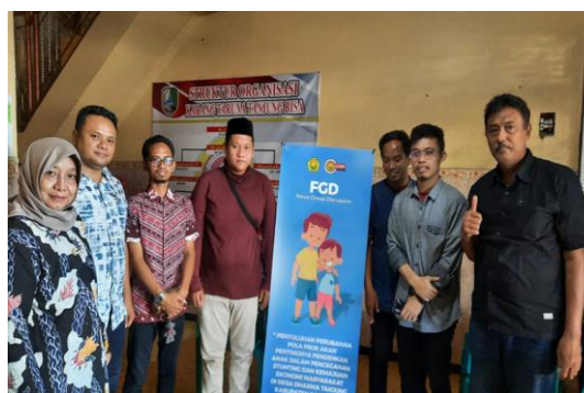
Gambar 3. Foto Bersama dengan Perangkat Desa dan Kepala Dusun.

Berdasarkan hasil wawancara pada Kepala Dusun dari 6 dusun yang ada di Desa Dharma Tanjung adalah sebagai berikut.