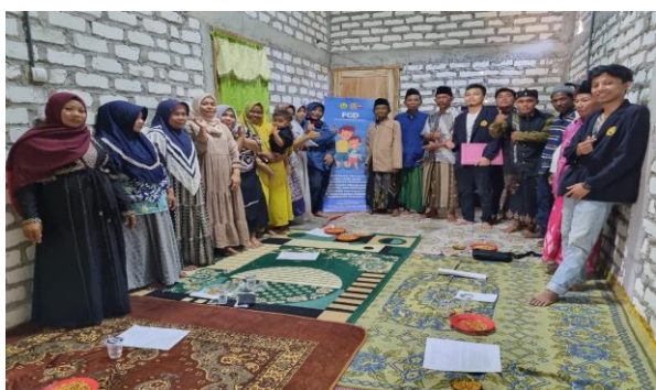
Gambar 4. Peserta Penyuluhan Pentingnya Perubahan Pola Pikir Pentingnya Pendidikan Anak, Pola Makan, dan Pembuatan Rumah Tinggal.

Dalam kaitannya kasus gizi buruk dan stunting, sudah sering dilakukan riset dan pengabdian yang berfokus dari teori-teori kesehatan, Hasilnya penurunan angka gizi buruk dan stunting bersifat fluktuatif. Artinya angka penurunan gizi buruk dan stunting di masyarakat tidak dapat dipastikan hasilnya atau masih turun naik yang tidak dapat dipastikan dalam setiap tahunnya, walaupun berbagai macam cara dan berbagai macam subsidi makanan bergizi yang tidak sedikit jumlahnya. Dalam pengabdian ini dilakukan sebagai hasil riset tahun 2022, bahwa pola pikir yang berbentuk kalimat dapat menjadi penyebab tingginya angka gizi buruk dan stunting, studi kasus di Kabupaten Sampang.