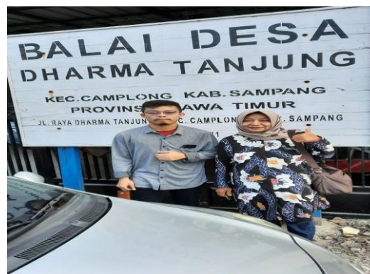
Gambar 1. Foto Di Depan Kantor Desa Dharma Tanjung

pentingnya pendidikan anak, pola makan, dan pola pikir akan pentingnya pembuatan rumah tinggal.