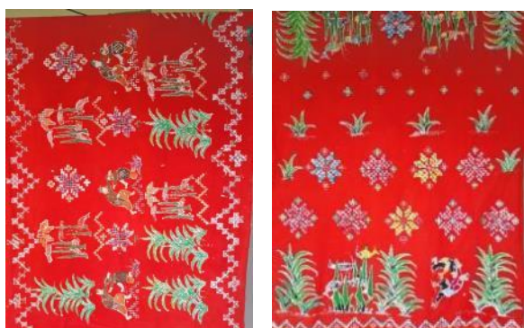
Gambar 10. Produk kain hasil pelatihan batik