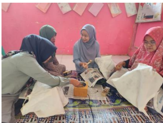
Gambar 6. Instruktur mendampingi proses mencanting

yang sesuai. Sama halnya dengan proses mendesain pada proses ini para peserta melatih keterampilan mencanting pada bidang kain dengan ukuran yang lebih kecil yaitu tas kain yang sebelumnya sudah digambar.