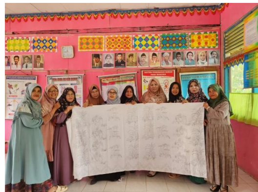
Gambar 5. Salah satu hasil desain batik yang sudah dipindahkan ke kain panjang