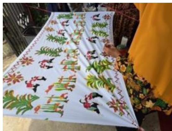
Gambar 7. Proses mewarnai kain

Proses menembok adalah menutup motif yang sudah diwarnai dengan lilin menggunakan canting tembok yang berukuran paling besar. Proses pewarnaan dasar dilakukan dengan menggunakan kuas dengan ukuran yang besar dan kain harus dibentangkan supaya memudahkan proses kerja dan mengontrol kerataan warna pada kain.