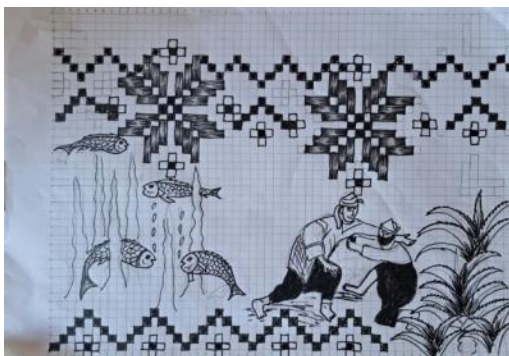
Gambar 3. Desain motif batik Paninggahan rancangan peserta

utama. Untuk proses belajar para peserta di tahap awal memindahkan desain ke kain dengan ukuran yang lebih kecil yaitu pada sebuah tas kain polos dengan ukuran 40 x 50 cm. Setelah itu baru kemudian para peserta menerapkannya pada kain dengan ukuran yang lebih besar dengan ukuran 110 x 250 cm.