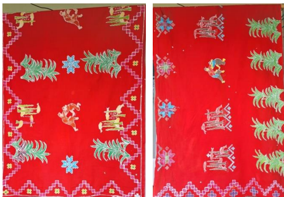
Gambar 9. Produk kain hasil pelatihan batik