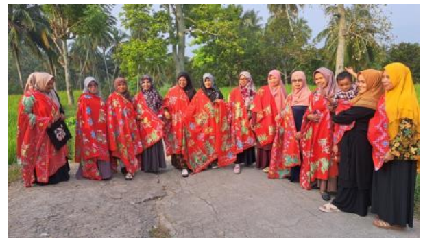
Gambar 11. Peserta pelatihan beserta kain batik hasil pelatihan