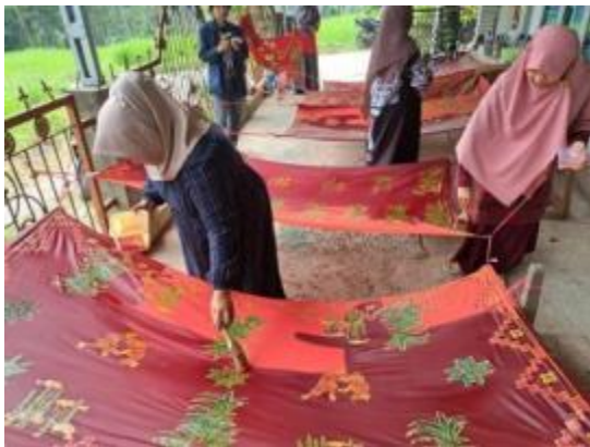
Gambar 8. Proses Mengunci warna batik

kain, tahap ini adalah proses merebus kain untuk menghilangkan lilin/malam pada kain. Setelah selesai dilorod kain kemudian dicuci hingga bersih.