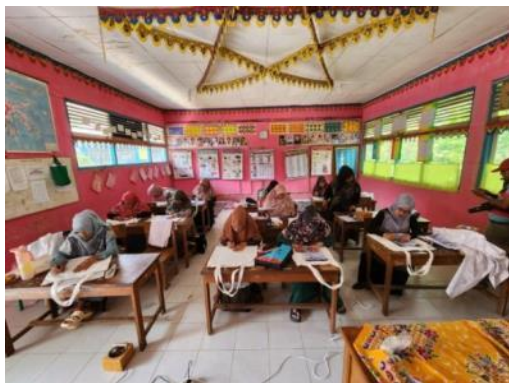
Gambar 4. Proses mendesain dan memindahkan motif ke kain