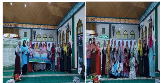
Gambar 5. Foto bersama

Tim pengabdian kepada masyarakat terdiri dari 7 orang yang berasal dari 3 Fakultas di lingkungan UPR. Jumlah peserta yang hadir sebanyak 19 orang, yang terdiri dari anggota kelompok Pengajian Dharma Wanita UPR dan masyarakat umum di sekitar mesjid Shalahuddin UPR, Kota Palangka Raya (Gambar 5).