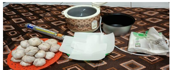
Gambar 2. Alat dan bahan untuk pembuatan bawang hitam

Bahan dan peralatan yang digunakan untuk pembuatan fermentasi bawang putih lokal di antaranya adalah magic com kapasitas 1,8 L, 2 kg bawang putih mentah, 2 pack kertas tisu bertekstur kasar, aluminium foil, baki plastik dan toples plastik untuk wadah penyimpanan bawang hitam hasil proses fermentasi (Gambar 2).