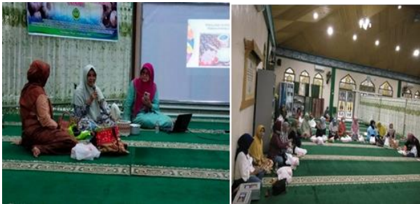
Gambar 6. Sesi tanya jawab oleh peserta pelatihan (Dokumentasi pribadi, 2022).

Setelah penyampaian materi, dilanjutkan dengan sesi tanya jawab dan praktek secara langsung. Peserta sangat antusias mengajukan pertanyaan-pertanyaan (Gambar 6).