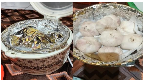
Gambar 4. Proses penyusunan lapisan bawang putih di dalam magic com.

Tahap berikutnya bawang putih disusun ke dalam wadah magic com pada posisi urutan terbawah, kemudian di atasnya dilapisi dengan kertas tisu sebanyak 2 lapis, dilanjutkan susunan bawang putih dan lapisan kertas tisu. Proses ini dilakukan hingga bawang putih habis, kemudian bagian atas ditutup dengan kertas tisu dan terakhir ditutup dengan aluminium foil (Gambar 4).