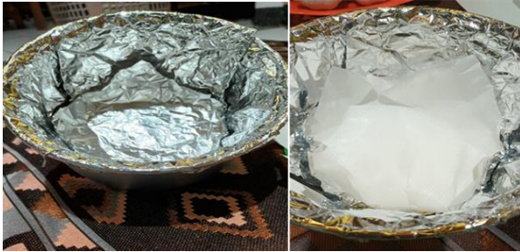
Gambar 3. Pelapisan wadah Magic Com dengan aluminium foil dan kertas tisu (Dokumentasi pribadi, 2022).

Tahap berikutnya bawang putih disusun ke dalam wadah magic com pada posisi urutan terbawah, kemudian di atasnya dilapisi dengan kertas tisu sebanyak 2 lapis, dilanjutkan susunan bawang putih dan lapisan kertas tisu. Proses ini dilakukan hingga bawang putih habis, kemudian bagian atas ditutup dengan kertas tisu dan terakhir ditutup dengan aluminium foil (Gambar 4).