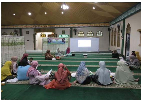
Gambar 1. Peserta pelatihan menyimak penyampaian materi pelatihan (Dokumentasi pribadi, 2022)

Metode kegiatan dilakukan melalui interaksi secara langsung dengan peserta, diawali dengan memberikan daftar pertanyaan (kuesioner) kepada peserta sebelum pelatihan supaya dapat diukur tingkat pemahaman dan keberhasilan dari kegiatan pengabdian ini. Kuesioner juga diberikan setelah selesai kegiatan. Sosialisasi materi melalui pemaparan PPT menggunakan LCD Projector tentang manfaat bawang hitam dari hasil fermentasi bawang putih (Gambar 1), dilanjutkan dengan praktek secara langsung pembuatan fermentasi bawang putih lokal dan sesi tanya jawab.