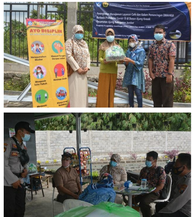
Gambar 2. FGD dengan berbagai pihak

Pada gambar 2 dilakukan diskusi yang dihadiri oleh pihak pengelola OMAHKUI, DANRAMIL, tim pelaksana, dan masyarakat. Untuk menjaga ketertiban pemberlakuan PPKM dan distancing dimasa pandemik Covid19. Tim juga memberikan bantuan untuk alat protokol Covid-19 mulai dari stand termometer, alat cuci tangan, dan bahan sterilisasi.