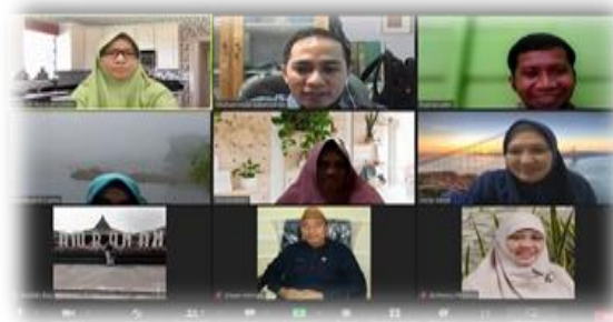
Gambar 1. Perencanaan dan Persiapan

Persiapan dalam kegiatan ini dilakukan secara online melalui zoom meeting dalam bentuk seminar dengan tujuan agar guru_guru memahami dan mengetahui desain pembelajaran yang berbasis digital di era abad 21 ini. Proses kegiatan ini dimulai dari koordinasi dengan lembaga mitra dan Dinas Pendidikan Kabupaten Gorontalo Utara, terkait dengan undangan peserta yang hadir dalam kegiatan penyuluhan. Tim pelaksana kegiatan mempersiapkan pemateri nasional dan lokal melalui kerja sama dengan mitra, dalam hal ini Kampus Universitas Negeri Gorontalo dan Dinas Pendidikan Kabupaten Gorontalo utara untuk kepastian dalam memberikan materi pada saat kegiatan yang di tentukan. Pengaturan kegiatan dan rincian jumlah peserta menjadi hal penting dalam pelaksanaan kegiatan. Selain itu, tim pelaksana bertanggung jawab untuk mengatur persiapan kegiatan. Langkah ini dilakukan agar bisa berjalan dengan lancar, terutama persiapan kebutuhan, mulai peserta, media dan peralatan yang digunakan dalam kegiatan.