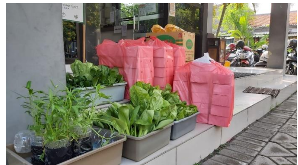
Gambar 6. Sebagian sayuran hidroponik serta bingkisan pretes dan postes

Acara penyuluhan dimulai pada pukul 9 pagi dan selesai sekitar pukul 10.30 pagi. Kegiatan tersebut diadakan bersamaan dengan waktu pelayanan poliklinik Puskesmas Dukuh Kupang Surabaya. Keseluruhan rangkaian acara penyuluhan selesai dalam waktu 1 jam 30 menit.