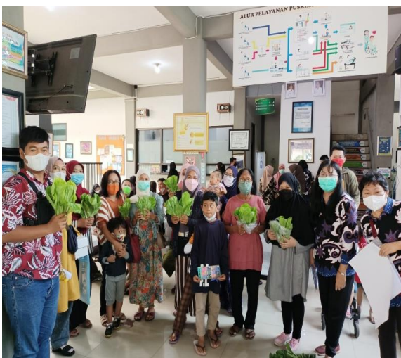
Gambar 5. Pembagian Sayur Hidroponik untuk Para Penanya

Penyuluhan tentang Pencegahan Kanker Usus Besar dengan Sayuran Hidroponik juga menunjang program Pemerintah dan program Tridarma Perguruan Tinggi UWKS khususnya program Pengabdian Masyarakat Fakultas Kedokteran UWKS.