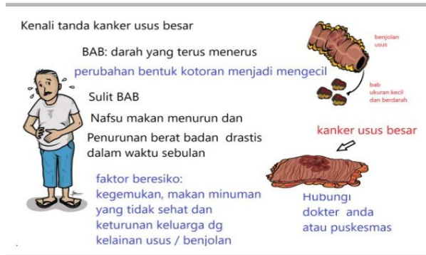
Gambar 1. Poster/Leaflet tentang Kanker Usus Besar

Alat bantu yang digunakan selama penyuluhan adalah poster, leaflet dan alat peraga bertanam hidroponik. Contoh poster dan leaflet yang digunakan adalah sebagai berikut: