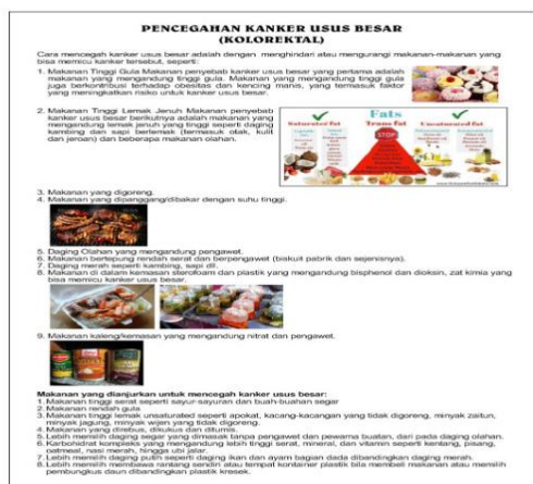
Gambar 2. Poster/Leaflet tentang Nutrisi Pencegah Kanker Usus Besar

Poster yg dicetak sebanyak 3 buah dengan materi Kanker Usus Besar, Nutrisi Pencegah Kanker Usus Besar dan Cara Menanam Sayur secara Hidroponik. Masing-masing poster berukuran 40 cm x 70 cm.