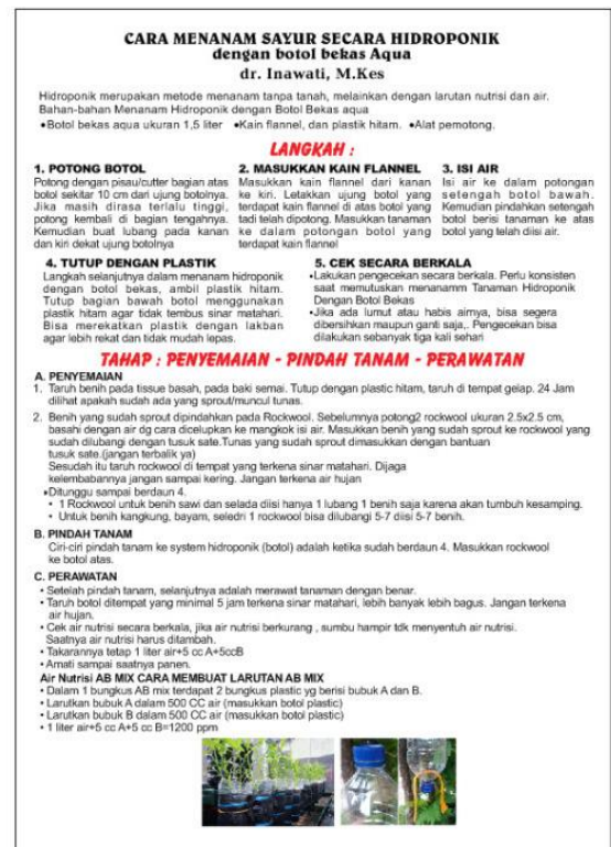
Gambar 3. Poster/Leaflet tentang Cara Menanam Sayur secara Hidroponik