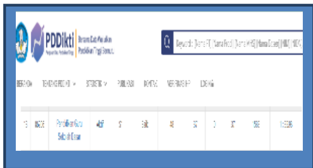
Gambar 1. Screenshot Profil PGSD UM Buton melalui Forlap Dikti

Di halaman forlap dikti, program studi Pendidikan Guru Sekolah Dasar dapat ditunjukkan pada scranshoot di bawah ini: