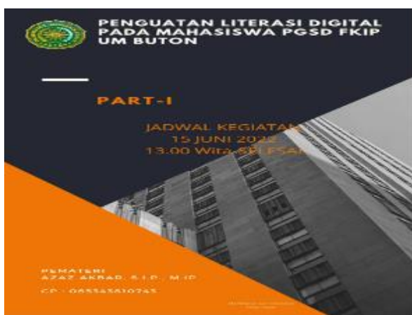
Gambar 2. Proses Desain Brosur Kegiatan

Tahap kegiatan dimulai dengan pembuatan brosur. Pada tahap ini diberikan tugas kepada 1 orang tim untuk mendesain brosur.