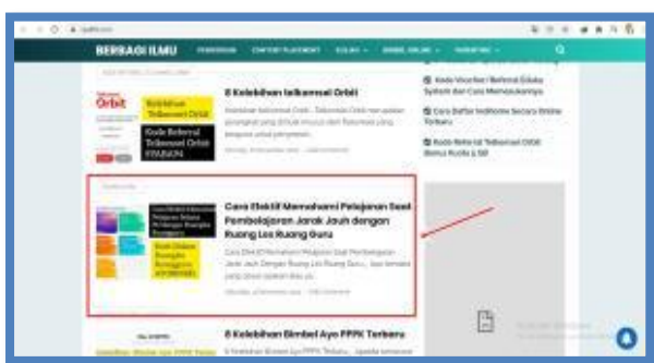
Gambar 3. Artikel tentang Pembelajaran Jarak Jauh (PJJ).

Pada gambar di atas artikel dengan judul: 7 Cara Mendidik Anak Agar Sholeh dan Berbakti Pada Orangtua, menempati posisi kedua di google dalam pencarian dengan kata kunci “cara mendidik anak agar sholeh dan berbakti pada orangtua. Adapun jumlah kunjungan pada tulisan tersebut yang tertera pada gambar di atas telah sampai 20.000 lebih kunjungan.