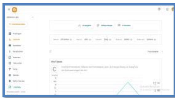
Gambar 1. Dashboard Website rijal09.com

Berikut beberapa gambar keterangan proses pengabdian yang telah dilakukan: