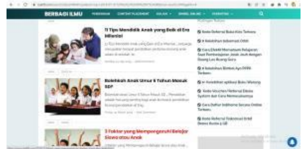
Gambar 4. Tag atau Kategori Artikel tentang Anak

bisa menjadi refrensi bagi orangtua dalam mendampingi anak dalam pembelajaran jarak jauh.