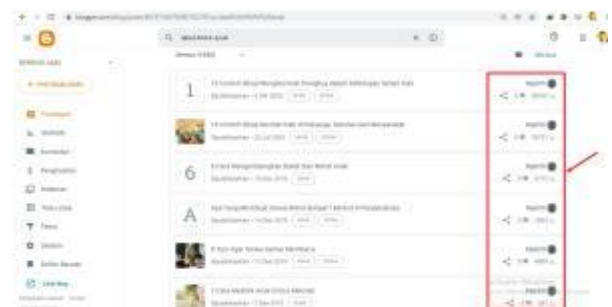
Gambar 5. View Artikel

Pada gambar di atas, merupakan tulisan-tulisan yang berisi tentang tag tentang anak. Kategori tentang anak mencapai 100 artikel lebih dan, bisa menjadi refrensi orangtua dalam mendidik anak.