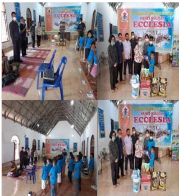
Gambar 4. Acara Penutup dan Penyerahan Cinderamata

galon tempat air untuk cuci tangan), serta dosen menyerahkan sembako sebagai bantuan pribadi para dosen, dan kemudian foto-foto bersama anak panti.