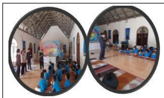
Gambar1. Pembukaan dan Perkenalan