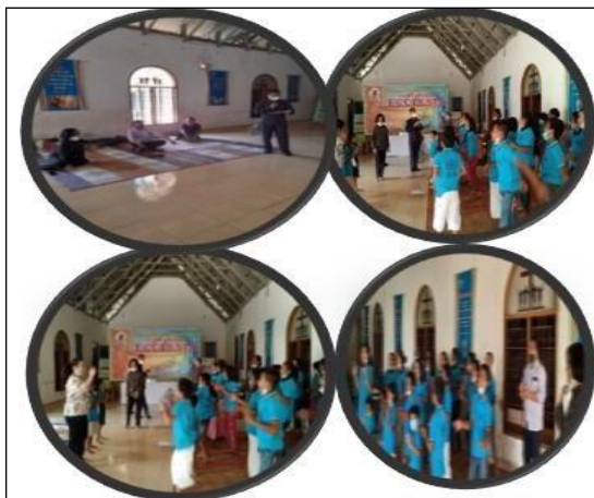
Gambar 2. Acara Ibadah

membaca Firman Tuhan, bernyanyi, dan doa penutup.