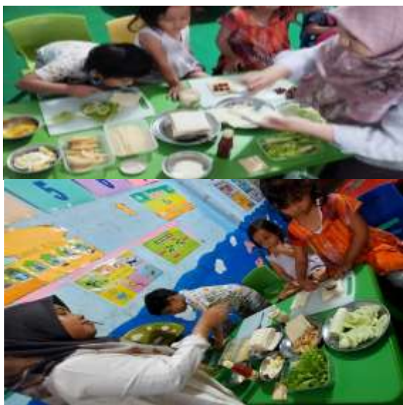
Gambar 2. Praktik membuat sandwich sayur dan sandwich buah

Melalui kegiatan ini, anak memperoleh pengalaman belajar yang menyenangkan sekaligus pemahaman awal mengenai pentingnya memilih jajanan yang sehat dan bergizi.