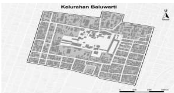
Gambar 1. Peta Lokasi Kegiatan

Permasalahan sampah perkotaan terus meningkat seiring bertambahnya aktivitas rumah tangga, kepadatan permukiman, dan perubahan pola konsumsi masyarakat. Sampah organik rumah tangga perlu dikelola sejak dari sumber karena komponen ini berkontribusi besar terhadap timbulan sampah harian dan berpotensi menimbulkan masalah lingkungan apabila langsung dibuang tanpa pengolahan. Pengelolaan sampah yang masih didominasi pola kumpul–angkut–buang menyebabkan sampah rumah tangga cenderung hanya dipindahkan dari lingkungan permukiman ke tempat pemrosesan akhir, tanpa pengurangan yang bermakna dari sumbernya. Beberapa kajian menunjukkan bahwa pengolahan sampah organik skala rumah tangga, seperti komposting dan pemilahan dari sumber, dapat mengurangi beban sampah yang masuk ke sistem pengangkutan dan tempat pemrosesan akhir. Namun, keberhasilan penerapannya masih sangat bergantung pada pengetahuan, kebiasaan, ketersediaan fasilitas pemilahan, serta partisipasi aktif masyarakat (Muyasaroh, 2025; Widiarti, 2012).