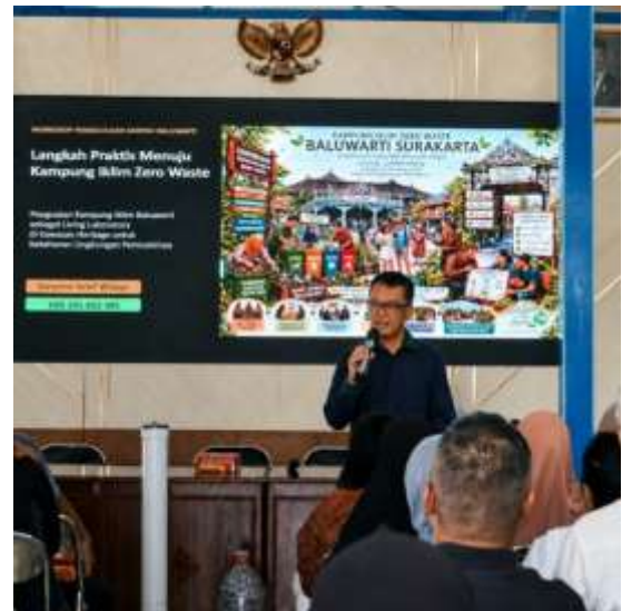
Gambar 3. Pelaksanaan Sosialisasi Pengelolaan Sampah Organik kepada Masyarakat Kelurahan Baluwarti