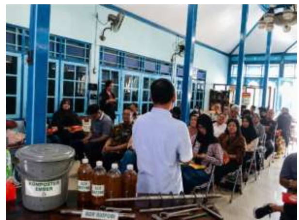
Gambar 4. Demonstrasi