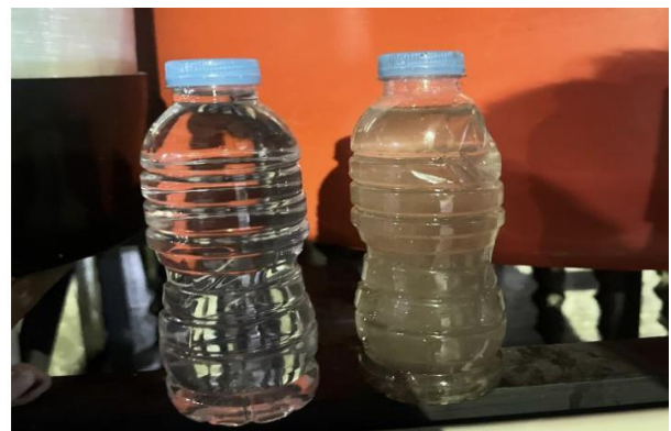
Gambar 6. Perbedaan Air Sebelum dan Sesudah Menggunakan Filter Air

Pemasangan tandon air bersih dan filter air telah dilakukan pada tanggal 11 Februari 2026. Teknologi sanitasi air bersih ini dipasang pada 5 titik yang sudah disepakati saat MMD yaitu 2 titik di Jorong Duo Koto, 2 titik di Jorong Taluak, dan 1 titik di Jorong Baiang. Paket Teknologi sanitasi air bersih ini terdiri dari pompa air, tandon air, filter air dan perlengkapan lain agar teknologi sanitasi ini bisa di operasikan. Sumber baku air yang dimanfaatkan adalah air yang berasal dari Danau Singkarak dan dari sungai. Pemasangan tandon air ini berlangsung selama 3 hari dengan dibantu oleh 5 orang teknisi air.