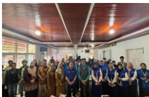
Gambar 4. Foto Bersama Kegiatan Pelatihan Manajemen Sanitasi Air Bersih di Aula Kantor Wali Nagari Guguk Malalo

Kegiatan pelatihan manajemen sanitasi air bersih sudah dilaksanakan pada tanggal 10 Februari 2026 dengan menghadirkan pakar dari Dinas Pekerjaan Umum Kabupaten Tanah Datar. Kegiatan pelatihan dihadiri oleh 60 orang peserta. Kegiatan ini diawali dengan pre-test dan post-test peserta terkait dengan sanitasi air bersih, pemeliharaan, dan pengawasan tandon air bersih.