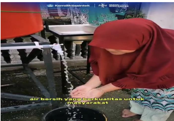
Gambar 7. Pemanfaatan Air Bersih dari Penerapan Teknologi Sanitasi Air Bersih Oleh Masyarakat Nagari Guguk Malalo

Evaluasi awal dilakukan dengan peninjauan awal dengan mitra untuk mengetahui kebutuhan mitra dalam pemulihan pascabencana, berdasarkan hasil peninjauan dan MMD dengan mitra, didapatkan permasalahan prioritas nagari guguk malalo adalah terkait dengan kebutuhan air bersih. Evaluasi proses dilakukan melalui pengukuran peningkatan pengetahuan mitra sebelum dan sesudah dilakukan pelatihan manajemen sanitasi air bersih (ada peningkatan dari 63 poin menjadi 78,5). Evaluasi akhir dilakukan melalui pengukuran peningkatan kapasitas mitra sebelum dan sesudah dilakukan pelatihan manajemen sanitasi air bersih, keterlaksanaan SOP oleh mitra, serta efektivitas teknologi sanitasi yang digunakan melalui kemudahan akses dan pemanfaatan air bersih oleh masyarakat Nagari Guguk Malalo.