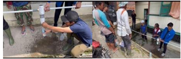
Gambar 2. PkM Tanggap Bencana UPN Bukittinggi di Kenagarian Guguak Malalo

Kenagarian Guguak Malalo Kecamatan Batipuh Selatan Kabupaten Tanah Datar termasuk wilayah dengan kerawanan bencana berulang (recurrent disaster), sehingga strategi pemulihan tidak dapat bersifat sementara. Dibutuhkan pendekatan yang mampu meningkatkan kapasitas adaptif masyarakat dalam mengelola sumber air bersih dan lingkungan secara mandiri. Penerapan teknologi sanitasi air bersih yang sederhana, aplikatif, dan berbasis potensi lokal menjadi kebutuhan mendesak untuk mempercepat pemulihan lingkungan sekaligus menurunkan risiko masalah kesehatan lanjutan pascabencana. Perguruan tinggi melalui Program Mahasiswa Berdampak memiliki peran strategis dalam mendukung percepatan pemulihan wilayah terdampak bencana. Universitas Prima Nusantara Bukittinggi memiliki rekam jejak pelaksanaan pengabdian masyarakat tanggap darurat di Kabupaten Tanah Datar, termasuk pendampingan kesehatan dan lingkungan pascabencana galodo. edukasi perilaku hidup bersih dan sehat, serta distribusi paket kebersihan yang menjangkau 100 kepala keluarga. Keterlibatan mahasiswa lintas disiplin menjadi kekuatan utama dalam mendampingi masyarakat menerapkan teknologi sanitasi air bersih, melakukan edukasi sanitasi lingkungan, serta mendorong partisipasi aktif masyarakat dalam proses pemulihan (Tanah Datar, 2025a, 2025b).