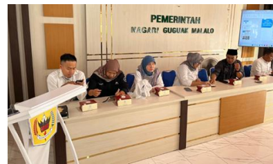
Gambar 3. Kegiatan MMD di Aula Kantor Wali Nagari Guguak Malalo

dengan kebutuhan air bersih dan kegiatan yang sudah disepakati adalah pelatihan manajemen sanitasi air bersih, pemasangan teknologi sanitasi air bersih pada 5 titik yang sudah disepakati, dan penyusunan peta titik sumber air bersih dinagari guguak malalo.