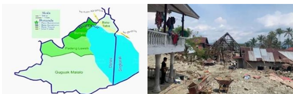
Gambar 1. Peta Lokasi dan Kondisi Sumber Air Masyarakat yang Tertutup Material dan Lumpur

Berdasarkan laporan situasi pemerintah nagari dan pendataan awal BPBD Kabupaten Tanah Datar, kejadian galodo berdampak pada sekitar \pm 850 – 900 kepala keluarga atau \pm 3.200 – 3.500 jiwa di Kecamatan Batipuh Selatan. Sekitar 35–40% rumah warga mengalami kerusakan ringan hingga berat, sementara infrastruktur lingkungan seperti saluran air, sumur gali, dan jaringan air bersih mengalami kerusakan dan pencemaran akibat lumpur serta material banjir (Tanah Datar, 2025a).