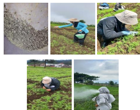
Gambar 2. Kegiatan demonstrasi; a) Perlakuan Benih; b) Pemupukan; c) Penjarangan; d) Penyiangan; e) Pengendalian OPT

Kegiatan demonstrasi dilakukan pasca penyampaian materi dengan mempraktikkan secara langsung mengenai cara perlakuan benih wortel dan tahapan pemeliharaan yang tepat oleh tim panitia yang bertugas. Peserta kegiatan pada sesi ini diberikan kesempatan untuk mempraktikkan langsung mengenai teknik perlakuan benih dan pemeliharaan tanaman wortel.