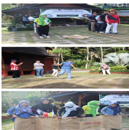
Gambar 1. Demonstrasi Pelaksanaan PkM

Pendampingan akan dilakukan dengan pola langsung dan tidak langsung. Pola langsung dilakukan pada saat kegiatan PKM dilaksanakan. Peserta dibimbing dan diarahkan untuk melaksanakan kegiatan outdoor activity yang telah disiapkan. Sedangkan pola tidak langsung disesuaikan dengan permasalahan, situasi dan kondisi proses pembelajaran masing-masing peserta.