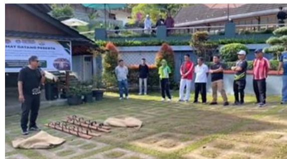
Gambar 2. Narasumber Mengevaluasi Pelaksanaan Kegiatan

Setelah memberikan workshop dan mendemonstrasikan kegiatan, kemudian dilaksanakan evaluasi untuk melihat apakah terjadi peningkatan pemahaman dan penerapan outdoor activity oleh peserta. Selain evaluasi juga diberikan umpan balik dan tindak lanjut berupa mentoring kegiatan melalui penugasan pada masing masing peserta. Tugas-tugas tersebut dapat dikirimkan melalui google drive yang telah diberikan. Pada tahapan evaluasi ini dipastikan semua peserta dapat mampu menerapkan dan meningkatkan bagaimana mengintegrasikan kearifan lokal melalui kegiatan outdoor activity dengan pendekatan POAC dalam pembelajaran.