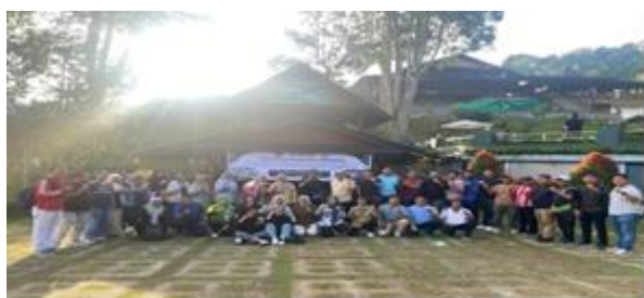
Gambar 5. Foto Bersama

berbasis budaya dapat menjadi strategi inovatif yang relevan dengan kurikulum dan bermanfaat untuk membangun karakter siswa secara holistik. Tidak kalah pentingnya, dengan pendekatan POAC yang digunakan, predikat guru PJOK yang lemah dengan segala bentuk laporan dan administrasi perlahan akan terpatahkan. Karena dengan menerapkan pendekatan POAC pada kegiatan outdoor activity berintegrasi kearifan lokal, guru dilatih untuk mendesain kegiatan pembelajaran menjadi lebih matang. Mulai dari tahapan Planing (merencanakan) segala bentuk kegiatan yang didukung oleh berbagai literasi yang relevan dengan pembelajaran, kemudian Organization (mengorganisasikan) kegiatan dalam berbagai bentuk, dilanjutkan dengan Action (aksi/pelaksanaan) di lapangan dan ditutup dengan Evaluation (evaluasi) dari kegiatan yang telah dilaksanakan apakah sesuai atau tidaknya kegiatan outdoor activity berintegrasi kearifan lokal bisa mencapai tujuan pembelajaran. Dengan melakukan langkah-langkah ini, diharapkan keberhasilan kegiatan ini dapat berkelanjutan, memberikan kontribusi dan berdampak langsung secara signifikan terhadap pengembangan kualitas guru PJOK di kota padang.