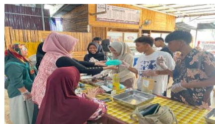
Gambar 4. Foto bersama peserta setelah pelatihan

Setelah pelatihan, peserta mendapatkan pendampingan untuk mengulang proses produksi secara mandiri. Pada tahap ini, peserta memperbaiki kesalahan teknis, bereksperimen dengan variasi rasa (misalnya, coklat dan kacang), serta memperbaiki kemasan dan pelabelan. Luaran dari tahap ini adalah kemampuan peserta untuk melakukan produksi mandiri dan menciptakan inovasi produk sederhana.