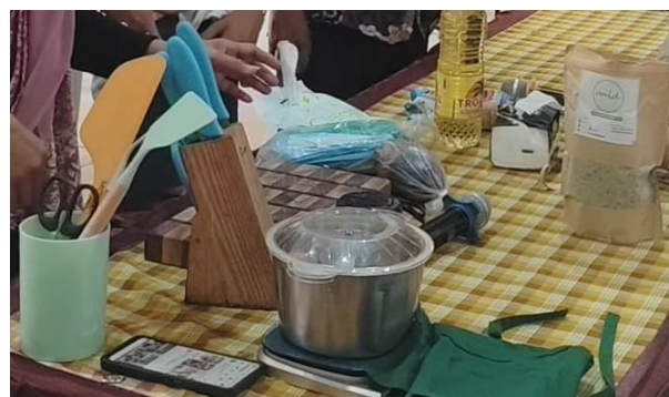
Gambar 1. Persiapan materi dan peralatan pelatihan

Pada tahap ini, tim telah melakukan rapat koordinasi dengan mitra UMKM untuk mengidentifikasi kebutuhan dan harapan mereka. Dari diskusi tersebut, terungkap bahwa mitra menghadapi tantangan dalam diversifikasi produk dan kurangnya pengetahuan tentang konsep pangan fungsional serta teknik pengemasan yang tepat. Berdasarkan masukan dalam diskusi, tim mengembangkan modul pelatihan sederhana yang disesuaikan dengan kondisi mitra. Selain itu, tim menyiapkan bahan-bahan yang dibutuhkan (biji labu, oat, madu, kacang tanah, susu bubuk) dan peralatan (oven, timbangan digital, mangkuk pengaduk, cetakan, dan alat pengemasan). Luaran dari tahap ini adalah: (1) kesepakatan dengan mitra mengenai fokus pelatihan, (2) modul pelatihan siap pakai, dan (3) persiapan bahan dan peralatan yang lengkap.