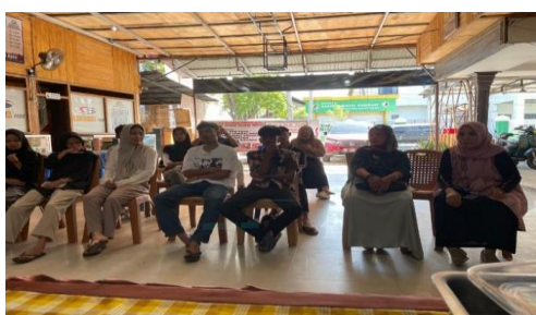
Gambar 2. Penyampaian materi teori kepada peserta

Peserta mengikuti sesi kuliah dan diskusi interaktif. Topik yang dibahas meliputi konsep pangan fungsional, kandungan nutrisi biji labu, potensinya sebagai agen pencegah cacangan, teknik pengolahan sederhana, dan peluang pasar lokal. Hasil dari tahap ini adalah peningkatan pemahaman peserta tentang manfaat dan potensi produk fungsional berbahan dasar biji labu.