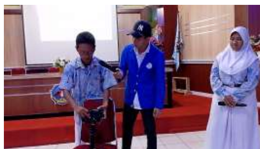
Gambar 5. Praktik Pengoperasian Kamera & Tripod dipandu Instruktur