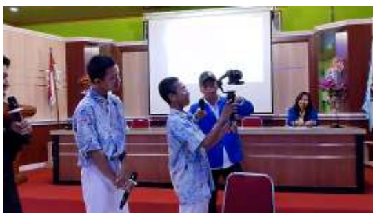
Gambar 7. Praktik Teknik Pengambilan Gambar yang Efektif

Dalam praktik pengambilan gambar, siswa diajarkan tentang pentingnya pencahayaan dan komposisi. Pencahayaan dapat menggunakan cahaya alami atau buatan untuk menciptakan suasana yang diinginkan, sedangkan komposisi melibatkan penempatan elemen visual dalam bingkai agar menarik secara estetika. Teknik gerakan kamera seperti panning , dolly , dan tilt juga diperkenalkan untuk memberikan dinamika pada pengambilan gambar. Misalnya, teknik dolly in dan dolly out digunakan untuk mendekatkan atau menjauhkan kamera dari objek tanpa menggerakkan objek itu sendiri.