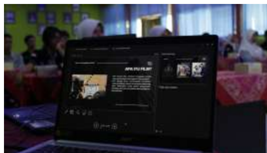
Gambar 2. Paparan Materi Sinematografi

Kegiatan pengabdian kepada masyarakat berjudul Peningkatan Kompetensi Komunikasi Audio Visual untuk Siswa-Siswi SMK Negeri 4 Semarang berfokus pada pengembangan keterampilan sinematografi sebagai bagian dari komunikasi audio visual. Sinematografi, yang merupakan seni dan teknik dalam menangkap dan mengolah gambar bergerak, sangat penting dalam menciptakan pesan yang efektif dan menarik bagi audiens. Menurut (Indeed, 2023), sinematografi pada dasarnya adalah seni merekam adegan video untuk film. Tugas seorang ahli sinematografi adalah untuk menghasilkan visi kreatif film dan membimbing cara cerita itu disampaikan secara visual di script/naskah . Dalam konteks ini, siswa diajarkan berbagai teknik dasar sinematografi, termasuk penggunaan sudut kamera, komposisi gambar, dan pencahayaan yang tepat. Teori-teori sinematografi, seperti yang dijelaskan oleh Joseph V. Mascelli, menekankan pentingnya pemahaman tentang camera angle , continuity , cutting , close up , dan composition untuk menciptakan narasi visual yang kuat.