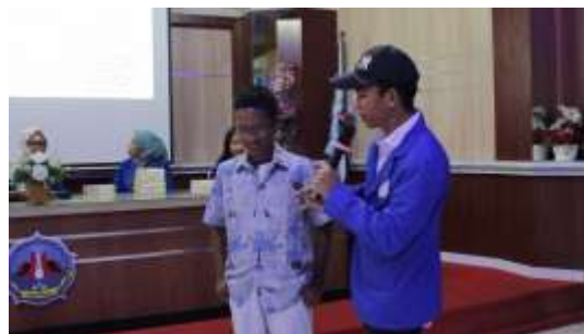
Gambar 4. Sesi Diskusi & Tanya Jawab bersama Peserta

Bagian terbaik dari kegiatan ini adalah praktik pengambilan gambar dan belajar cara menggunakan kamera. Aktivitas menyenangkan ini membantu mereka mencoba apa yang telah mereka pelajari dan memberi mereka latihan yang dapat membuat siswa-siswi lebih berani saat menggunakan peralatan kamera.