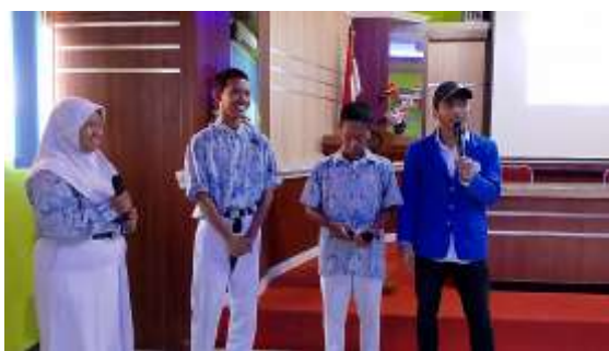
Gambar 8. Sesi Evaluasi & Diskusi bersama Peserta

Umpan balik dari peserta menunjukkan bahwa mereka merasa lebih percaya diri dalam kemampuan sinematografi mereka setelah mengikuti kegiatan pengabdian ini. Banyak dari siswa mengungkapkan rasa bangga terhadap hasil karya mereka dan merasa bahwa pengalaman ini telah memberikan wawasan baru tentang industri film dan media. Mereka menyadari bahwa keterampilan yang diperoleh tidak hanya bermanfaat untuk pendidikan formal tetapi juga dapat diterapkan dalam proyek-proyek pribadi atau profesional di masa depan.