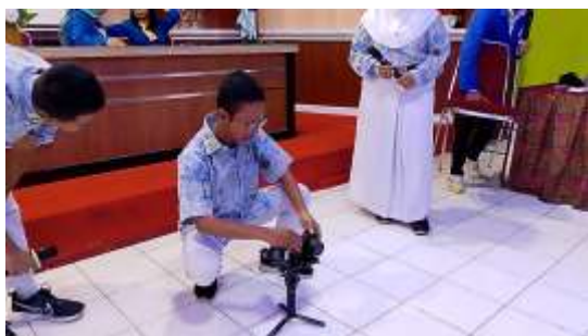
Gambar 6. Praktik Pengoperasian Lensa Kamera dipandu Instruktur