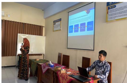
Gambar 1. Pembukaan Kegiatan