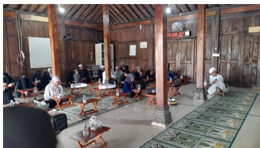
Gambar 2. Penyampaian materi di pesantren