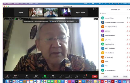
Gambar 4. Pendampingan secara online

baik mengenai karakteristik dan kebutuhan anak berbakat dengan hambatan penyerta serta strategi pengelolaan pembelajaran yang efektif, dan peserta dapat membangun kolaborasi antara pihak pesantren dengan keluarga sehingga mempunyai persamaan persepsi dalam mengelola pembelajaran sesuai dengan perannya masing-masing.