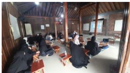
Gambar 3. Diskusi terarah

Kegiatan pelatihan dilanjutkan dengan diskusi terarah. Kegiatan diisi oleh peserta khususnya pengurus pesantren dengan menyampaikan studi kasus dalam pembelajaran bagi anak berbakat dengan hambatan penyerta, dan mendiskusikan alternatif penyelesaian studi kasus tersebut melalui diskusi bersama.