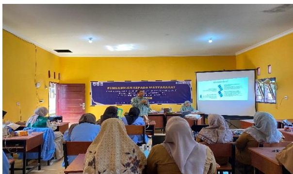
Gambar 2. Penyampaian Materi oleh Tim Pengabdian

Sebelum pemaparan materi workshop, para peserta diminta untuk mengisi google form terkait dengan pengetahuan dan pengalaman guru dalam menulis KTI. Selanjutnya, pada pertemuan ini tim PkM memaparkan materi tentang contoh-contoh karya tulis ilmiah beserta cara menulisnya yang baik dan benar. Perumusan jenis artikel, bagian-bagian artikel dan contoh gaya selingkung masing-masing jurnal untuk publikasi artikel. Kegiatan-kegiatan diuraikan secara rinci setiap bulan, kemudian diadakan evaluasi, sehingga dapat diketahui kegiatan yang telah dilaksanakan maupun yang belum terlaksana. Pada akhir kegiatan akan diketahui secara pasti tentang target kegiatan yang telah dicapai.