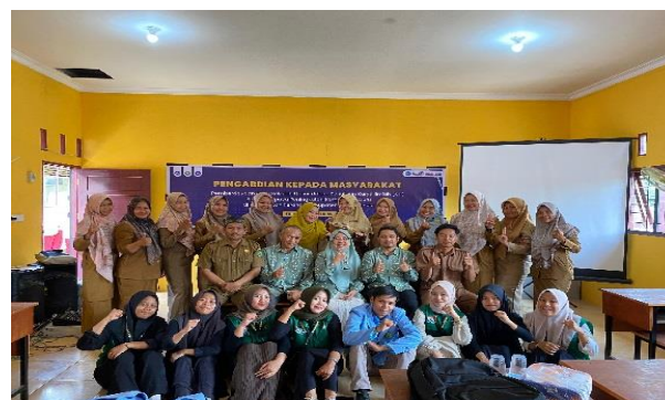
Gambar 3. Foto Bersama Setelah Kegiatan

Kegiatan pengabdian selanjutnya, peserta workshop yang sebelumnya sudah dibagi dalam beberapa kelompok, diminta untuk menunjukkan dan mempresentasikan hasil kerja kelompoknya dalam menulis KTI dan secara bergantian masing-masing kelompok menunjukkan hasil kerjanya. Setelah mempresentasikan penulisan KTI dan memberikan penilaian, selanjutnya diakhir kegiatan para peserta pengabdian dan narasumber melakukan sesi foto bersama untuk dokumentasi kegiatan.