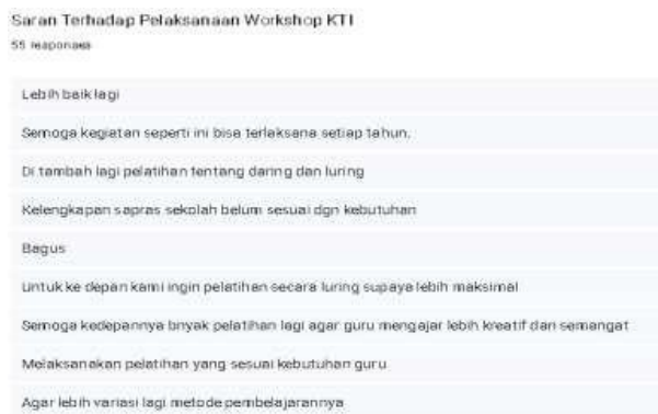
Gambar 8. Respon Saran Terhadap Pelaksanaan Workshop KTI

pelaksanaan tugas kinerja sebagai seorang guru. Sisanya sebesar 50,7 % memberikan respon bahwa pelatihan ini memberikan kontribusi dan manfaat yang baik dalam menunjang pelaksanaan tugas. Seperti yang kita ketahui salah satu cara meningkatkan kemampuan guru yang professional adalah dengan menulis karya ilmiah karena dapat mengatasi permasalahan yang sering dihadapi saat proses pembelajaran di sekolah. Selanjutnya adalah saran atau rekomendasi dari peserta kegiatan terkait dengan pelaksanaan workshop KTI yang sudah dilaksanakan dapat dilihat pada gambar berikut.