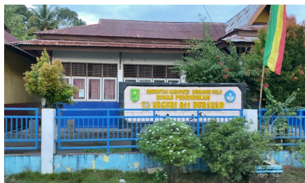
Gambar 1. Tempat Pelaksanaan Kegiatan

Kegiatan Pengabdian kepada Masyarakat (PkM) yang berjudul Pemberdayaan Guru Sekolah Dasar dalam Penulisan Karya Tulis Ilmiah (KTI) sebagai Upaya Peningkatan Kompetensi Guru di Kecamatan Peranap telah dilaksanakan selama dua hari yakni tanggal 19-20 Agustus 2024 dengan jumlah peserta sebanyak 20 orang guru yang berasal dari SDN 011 Peranap, SDN 003 Peranap, dan SDN 018 Peranap. Kegiatan pengabdian ini dilaksanakan di ruangan aula SDN 011 Peranap.