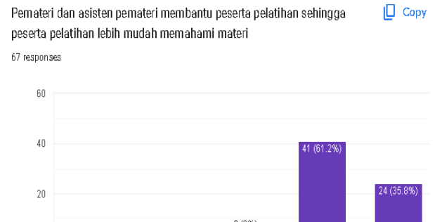
Gambar 6. Respon Peserta Terhadap Pemateri Kegiatan

Berdasarkan gambar 5 di atas dapat disimpulkan bahwa sebanyak 38,8% memahami teknik penulisan artikel ilmiah khususnya penelitian tindakan kelas, sedangkan sebanyak 61,2% memahami teknik penulisan artikel dengan baik. Materi artikel ilmiah ini disajikan secara runtut sehingga peserta mudah memahami materi yang sudah disajikan.