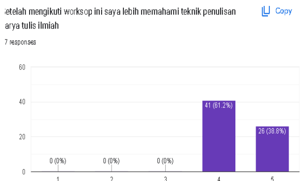
Gambar 5. Respon Peserta Terhadap Pemahaman Teknik dalam Penulisan KTI

Berdasarkan gambar di atas dapat diketahui bahwa hasil angket evaluasi kegiatan 49,3% peserta memahami materi dengan sangat baik dan 50,7% memahami materi dengan baik. Materi yang disajikan terstruktur sehingga peserta pelatihan memahami dengan baik materi penulisan artikel ilmiah yang telah disampaikan oleh narasumber.